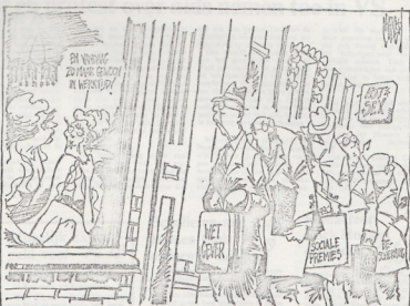
tekening Jan Cillings

Alle gekrat over vergunningenstelsels en arbeidsrechtelijke aspecten van de prostitutie telt op, wordt echter een tevens zichtbaar dat juist de meest kwetsbare vorm van prostitutie, die tevens de meest kwetsbare groep herbergt, aan haar lot over wil laten. In de gemeente Amsterdam wordt gepraat